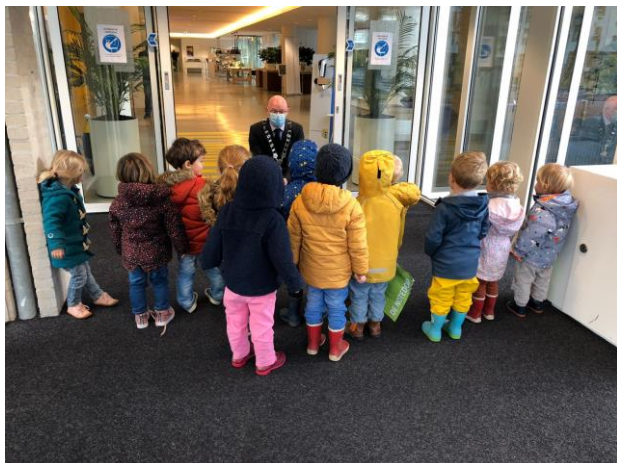
Knuffels van alle kinderen en groeten van de juffen van groep blauw.

Dit was een leuk avontuur om zo onverwacht deze belangrijke post bij de burgemeester persoonlijk te overhandigen.